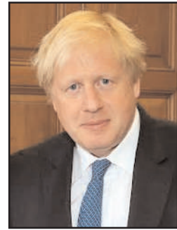
Mnr Boris Johnson

Dit is interessant dat Johnson vir Jacob Rees-Mogg as die leier van die Huis van Verteenwoordigers aangestel het. Mogg was die persoon wat in Februarie vanjaar gesê het dat die vroue en kinders tydens die Engelse Oorlog in Suid-Afrika in konsentrasiekampe aangehou is om hulle te versorg. Die HNP het toe in 'n verklaring gesê mnr Mogg skuld die Afrikaner-