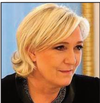
Marine le Pen

daarop aangedring dat, indien sy Macron verslaan, dié verkiesing ook as 'n referendum beskou sal word en dat Macron dan as president van Frankryk moet bedank.