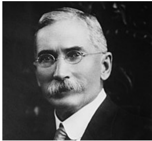
Genl. J.B.M. Hertzog

Op versoek van dr. Malan het die wet op 31 Mei 1928 in werking getree. Op daardie datum is die Unievlag vir die eerste keer amptelik gehys. 15 Daarmee