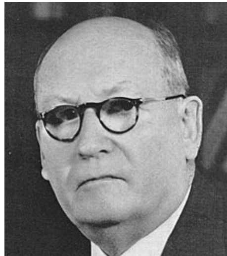
Dr. D.F. Malan

Die vlagkwessie het prominensie in die koerante geniet en gemoedere het hoog opgelaai. Die SAP-koerante was venynig teen die idee van 'n eie Suid-Afrikaanse vlag en sou onder geen omstandighede 'n vlag aanvaar waarop die Union Jack nie prominent gepryk het nie. Malan was egter vasbeslote en het gedurende die 1926-parlementsitting weer die vlagwetsontwerp voorgelê. Na die Eerste Lesing van die wet is dit na 'n gekose komitee verwys. Op dié komitee was die NP en die Oposisie asook die twee bevolkingseksies eweredig verteenwoordig. Aanvanklik het sir Patric Duncan, die SAP-LV vir