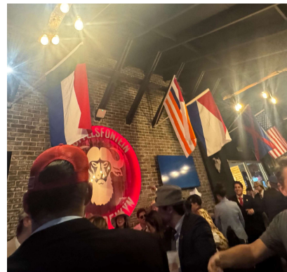
Vlae by cantus.

Slagmulder het ook tydens die besoek sy nuwe boek, Vlaamse voetsporen in Zuid-Afrika bekend gestel. Deckmyn werk ook tans aan 'n boek oor die Afrikaner se stryd om selfbeskikking. Die besoek het die reeds bestaande sterk verhouding tussen Afrikaners en Vlaminge verder laat verdiep. ■