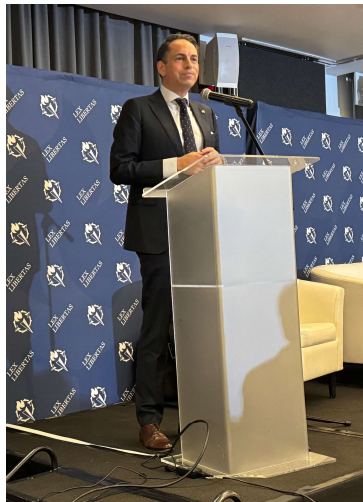
Tom van Grieken van Vlaams Belang aan die woord.